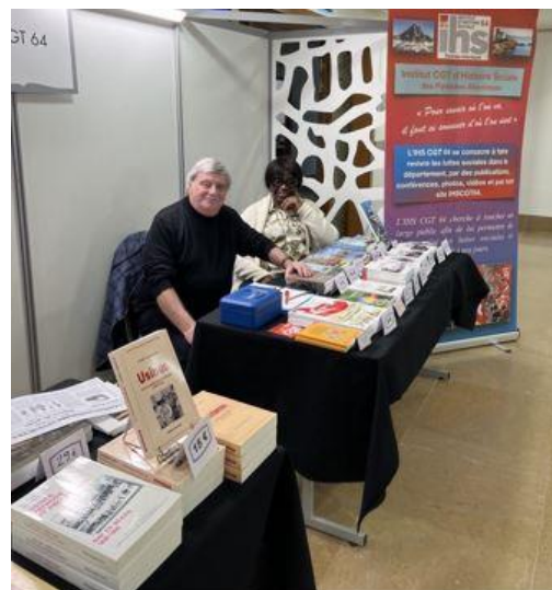
Salon du livre de Pau - Novembre 2025