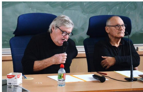
La CGT face au colonialisme avec Alain Ruscio - 22 octobre 2025