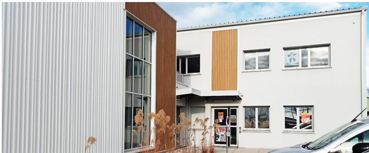
Les locaux de l'UD et de l'UL, rue Louis Blanc à Pau

J. Vidalenc, Louis Blanc, Paris 1948. Sources : Histoire de la France contemporaine – Tome III – Édition Sociale /L.C.D. 1969 - Biographie plus complète Maitron en ligne dictionnaire biographie du Mouvement ouvrier Français