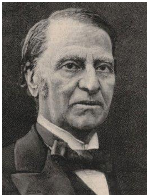
Louis Blanc

Journaliste, historien et homme politique, fils d'un inspecteur général des Finances du roi Joseph Bonaparte. Étudiant à Rodez puis à Paris, précepteur chez un industriel moderniste d'Arras, journaliste à Paris dès 1834, Louis Blanc collabora au National et au Bons Sens , et défendit les insurgés du procès d'Avril (1835).