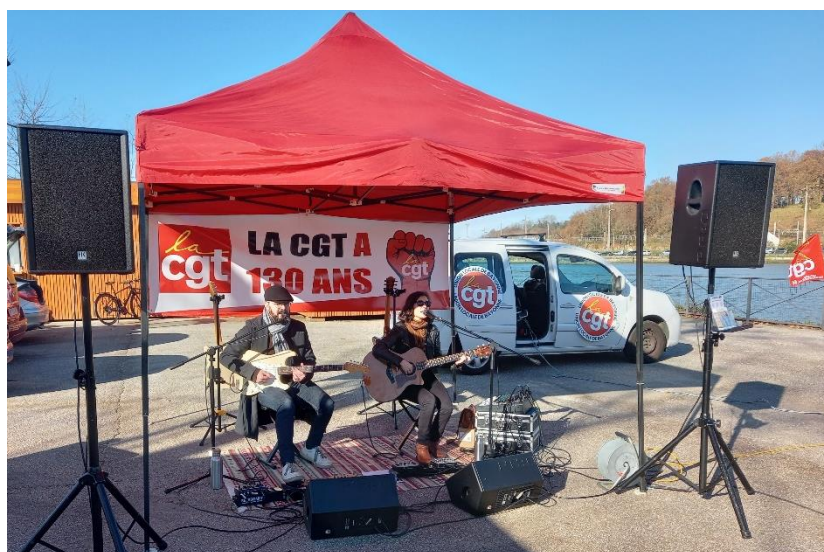
130 ans de la CGT à Bayonne - Décembre 2025